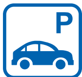
Parkings / places de parc