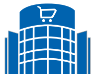
Centri Commerciali / Supermercati